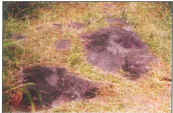
รอยตีนไดโนเสาร์กินเนื้อในกลุ่มคาร์โนซอร์