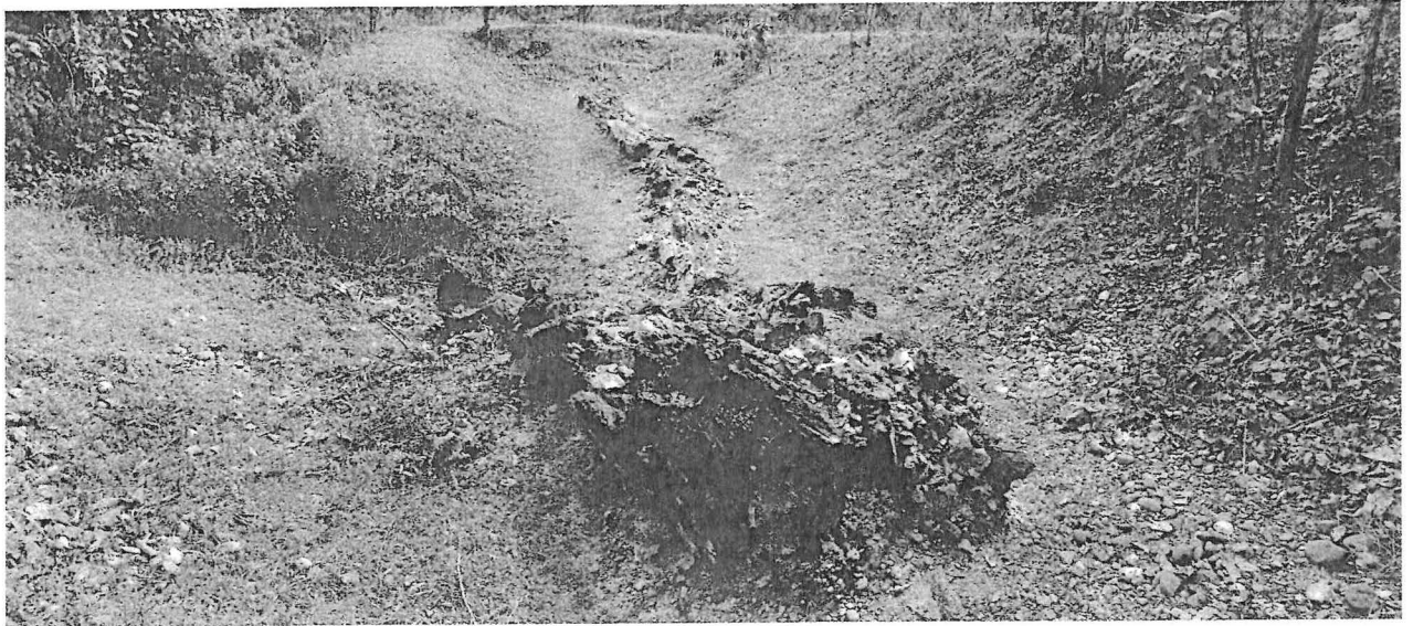
รูปถ่ายแสดงแหล่งซากไม้กลายเป็นหินจังหวัดตาก บริเวณหลุมขุดค้นที่ ๕ (มองไปทางทิศใต้)