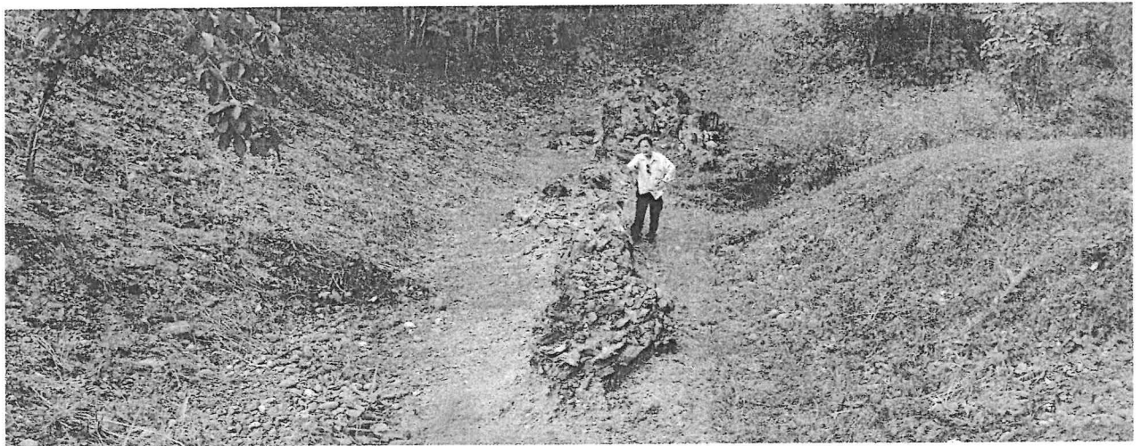
รูปถ่ายแสดงแหล่งซากไม้กลายเป็นหินจังหวัดตาก บริเวณหลุมขุดค้นที่ ๕ (มองไปทางทิศเหนือ)