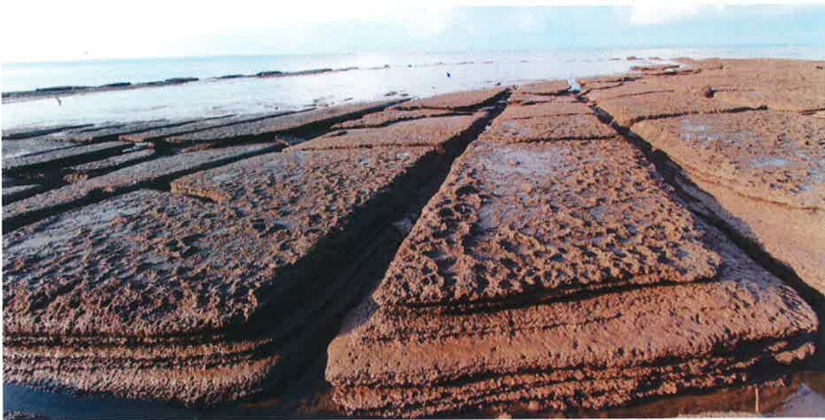
รูปถ่ายแสดงแหล่งซากสุสานหอยแกลมโพธิ์ (แกลมโพธิ์ ๑) จังหวัดกระบี่ (มองไปทางทิศใต้)