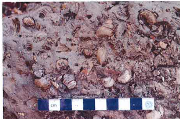
รูปถ่ายแสดงซากหอยในแหล่งสุสานหอยแกลมโพธิ์ (แกลมโพธิ์ ๑)