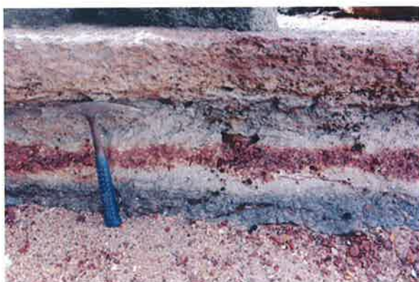
รูปถ่ายแสดงลำดับชั้นหิน โดยชั้นบนสุดเป็นชั้นซากหอย ในสุสานหอยแกลมโพธิ์ (แกลมโพธิ์ ๑)